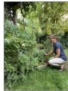
© Es summt auch im kleinsten Garten

Mehr: www.wettbewerb.wir-tun-was-fuer-bienen.de/eintrag/2024-tausche-rasen-gegen-staudenbeete