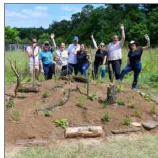
© Arche Bauernhof Erlangen Stadt und Land e. V.

www.wettbewerb.wir-tun-was-fuer-bienen.de/eintrag/2024-das-arche-prinzip